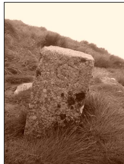
Hraniční kámen Československo-Polsko

viděli sotva na 20 metrů. Takže výhledy jsme si jen představovali. Večer jsme našťastí našli azyl v boudě strážců parku, kteří nás za zhruba 30 Kč na osobu nechali přespat. Dopoledne stále lilo a tak jsme na chatě zůstali do dalšího dne. Ráno jsme vyrazili na Hoverlu – nejvyšší